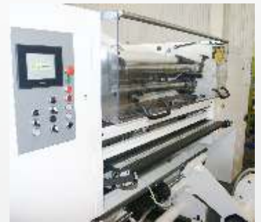
Ruchomy stolik do łączenia surowca